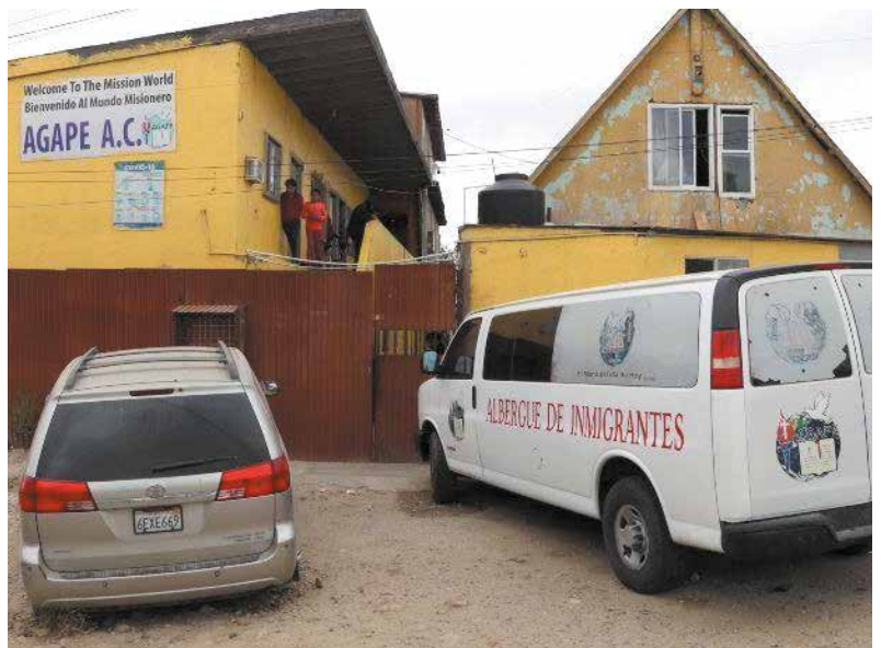
AGAPE se encuentra ubicado en la colonia Nueva Aurora en esta Ciudad.

americano y cruzar a Estados Unidos para empezar una nueva vida.