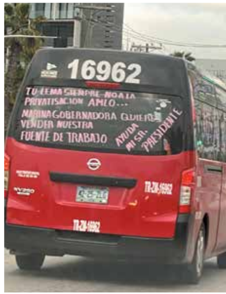
Las muestras de inconformidad se mostraron en todas partes durante la gira presidencial.

inconstitucional. Ahora vemos que el Poder Judicial confirma el argumento que se había dado de que es inconstitucional”, expuso el empresario.