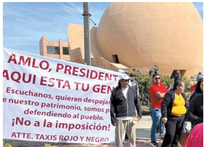
En todas las giras del Presidente a la región se han registrado contingentes de personas mostrando sus inquietudes.