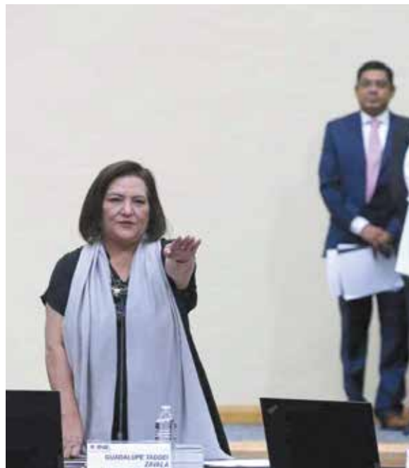
Guadalupe Taddei Zavala es la primera mujer en el cargo de Consejero Presidente del INE.