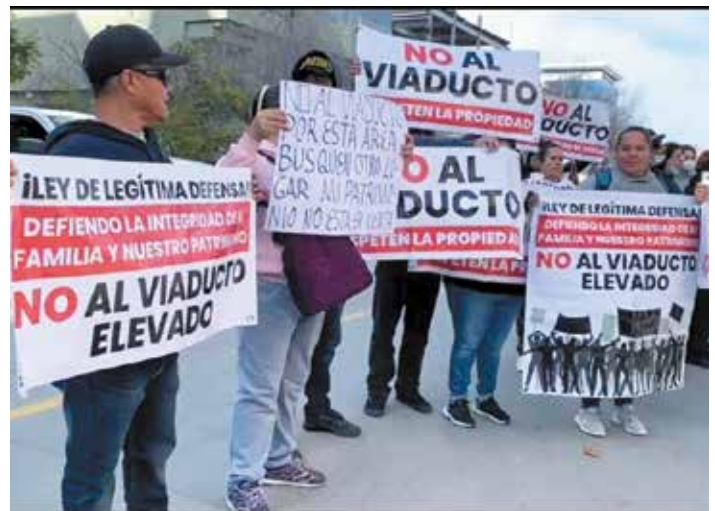
Propietarios de terrenos se manifestaron en contra del viaducto durante la visita del Presidente de la República.

Aunque a la protesta del pasado viernes 31 de marzo en Tijuana acudieron profesores que piden ser basificados, enfermos en busca de tratamiento, residentes de terrenos en la colonia Libertad que dicen estar siendo afectados por la construcción del viaducto a Playas de Tijuana, destacaron los